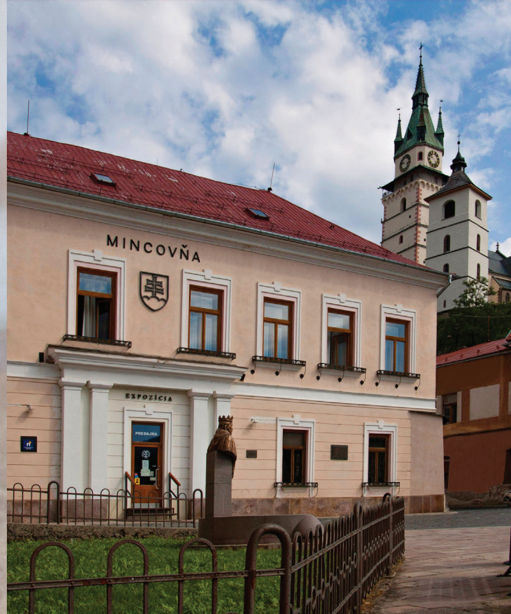
▲ Mincovňa v Kremnici, založená v roku 1328, v ktorej boli vyrazené slovenské eurové mince

Prípravy na zavedenia eura sa začali už pred vstupom Slovenska do Európskej únie. Národná banka Slovenska v spolupráci s Ministerstvom financií SR pripravili Stratégiu prijatia eura v Slovenskej republike, ktorú schválila vláda v júli 2003. Podrobné postupy v procese zavedenia európskej meny boli rozpracované v Národnom pláne zavedenia eura, ktorý bol schválený 6. júla 2005 uznesením vlády SR č. 525. Plán obsahoval jednotlivé kroky, ktoré bolo potrebné uskutočniť pre bezproblémové a úspešné zavedenie eura. Národná banka Slovenska začala bezprostredne po vstupe Slovenska do Európskej únie s prípravou národných strán slovenských eurových mincí, ktorá vyvrcholila v decembri 2005. Jej výsledkom boli tri víťazné návrhy, ktoré výstižne symbolizujú kultúrne a historické tradície a bohaté prírodné dedičstvo Slovenska.