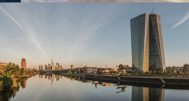
▲ Európska centrálna banka vo Frankfurte nad Mohanom