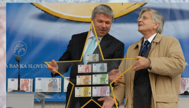
▲ 21. september 2008 – guvernér NBS Ivan Šramko s prezidentom ECB Jean-Claude Trichetom na otvorení Výstavy o eure v NBS

▲ Eurovú menu tvorí v súčasnosti sedem bankoviek a osem mincí. Eurové bankovky sú rovnaké vo všetkých krajinách. Ich motívom sú architektonické štýly rôznych kultúrnych epoch európskej histórie. Eurové mince majú jednu stranu spoločnú – je na nich vyobrazená jedna z podôb mapy Európy, dvanásť hviezd európskej vlajky, nominálna hodnota a názov menovej jednotky. Druhá strana je národná, s vlastnými motívmi štátov eurozóny. Pri slovenských eurových minciach je to dvojkríž na trojvrší (mince v nominálnej hodnote 1 euro a 2 eurá), Bratislavský hrad (mince v nominálnej hodnote 10, 20 a 50 centov) a vrch Kriváň (mince v nominálnej hodnote 1 cent, 2 centy a 5 centov).