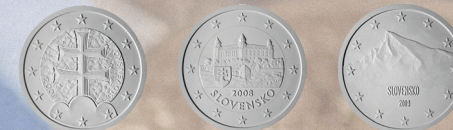
▲ Víťazné návrhy národných strán slovenských euromincí z roku 2005

▲ Európska komisia a Európska centrálna banka vo svojich pravidelných konvergenčných správach v máji 2008 potvrdili, že Slovensko je pripravené prijať euro od 1. januára 2009. Výmenný konverzný kurz bol stanovený v júli 2008 na 30,126 Sk za 1 euro. Prechod sa uskutočnil formou tzv. „veľkého tresku“ – naraz v bezhotovostnom aj hotovostnom platobnom styku, s krátkym 16-dňovým obdobím duálneho obehu slovenskej koruny aj eura.