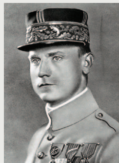
Milan Rastislav Štefánik