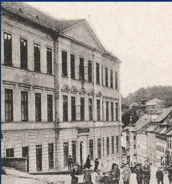
Evanjelické lýceum v Banskej Štiavnici