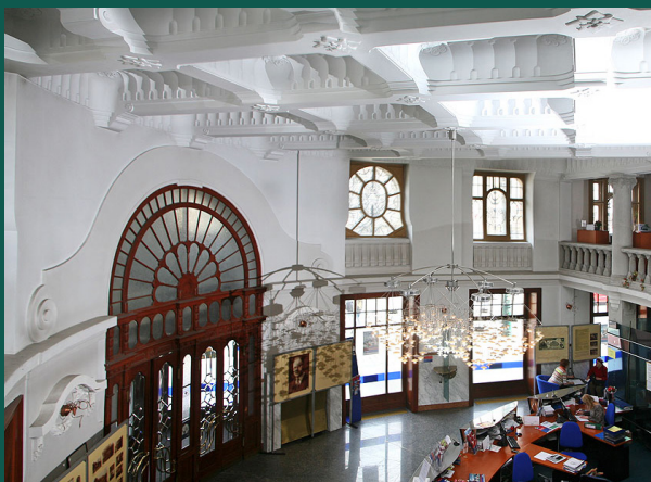
Interiér Bosákovho domu