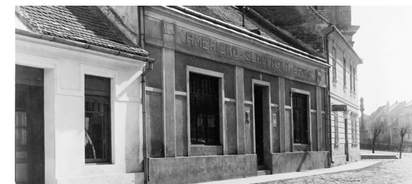
Pobočka Americko-slovenskej banky v Skalici