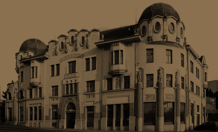
Dom Michala Bosáka v Prešove

Na rube zberateľskej euromince je vyobrazený portrét Michala Bosáka kompozične doplnený budovou Bosákovej štátnej banky v Scrantone a jej logom. V spodnej časti mincového poľa je meno a priezvisko MICHAL BOSÁK a pod ním letopočty narodenia a úmrtia 1869 - 1937.