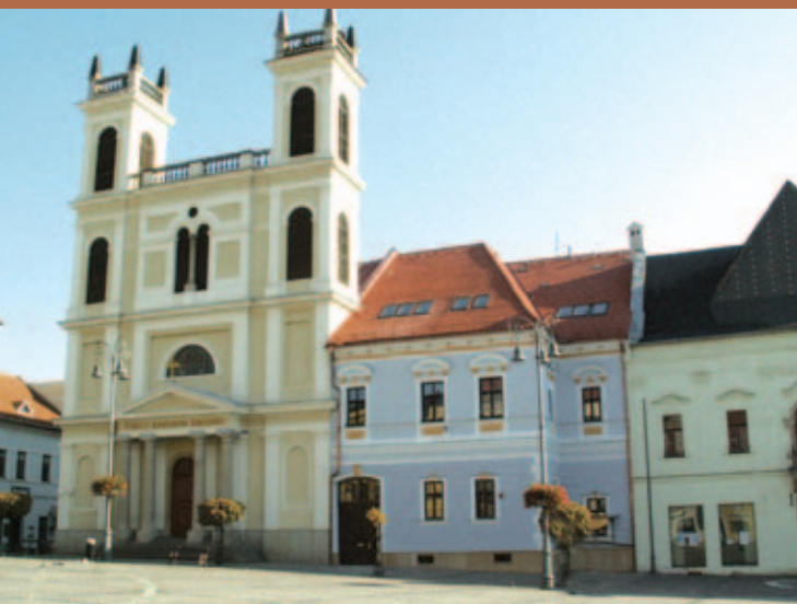
Kostol sv. Františka Xaverského

Po vypuknutí Slovenského národného povstania (1944) sa Banská Bystrica stala politickým, vojenským a administratívnym centrom povstaleckého Slovenska. V priestore pri mestských hradbách bol v roku 1969 otvorený pamätník SNP, ktorý je reprezentantom hodnotnej architektúry 60-tych rokov. Dnes je mesto významným kultúrnym a administratívno-správnym centrom.