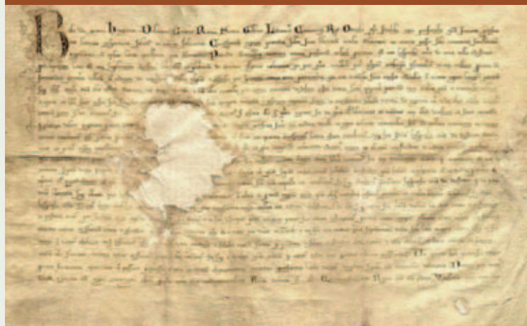
Originál zakladacej listiny kráľovského mesta Banská Bystrica, vydanéj zakladateľom Belom IV.

■ V roku 1380 mesto vstúpilo do Zväzu stredoslovenských banských miest. Ťažba bola až do polovice 16. storočia hlavným zdrojom bohatstva mesta.